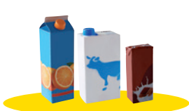
Toutes les briques alimentaires