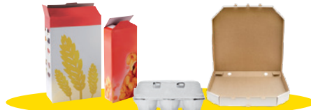
Tous les emballages en carton