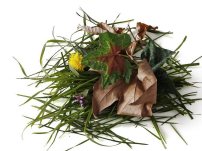
fleurs fanées, feuilles et déchets de jardin