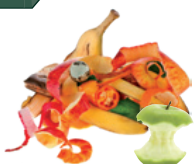
Les épluchures et restes de fruits et légumes