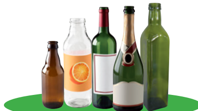
Les bouteilles en verre