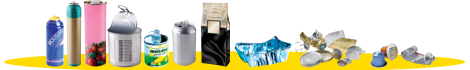
Tous les aérosols, bouteilles, boîtes, tubes et petits emballages en métal