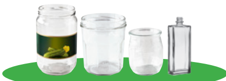
Les pots, bocaux et flacons en verre