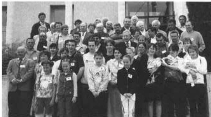
Voici le cliché qui rassemble tous les conscrits et leurs conjoints.

salle des fêtes, gracieusement mise à la disposition des 75 participants âgés de quelques mois à 90 ans. Les organisateurs étaient contents de compter parmi eux Monsieur et Madame le Maire qui avaient honoré leur invitation.