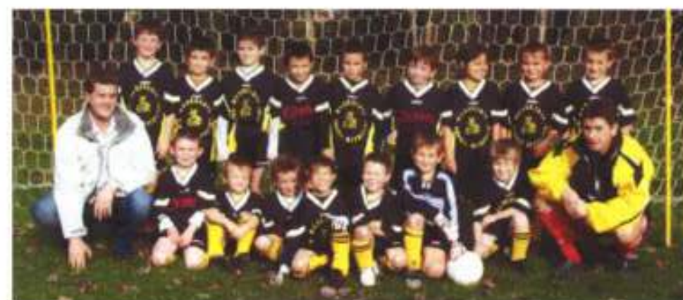
Les débutants du club sportif