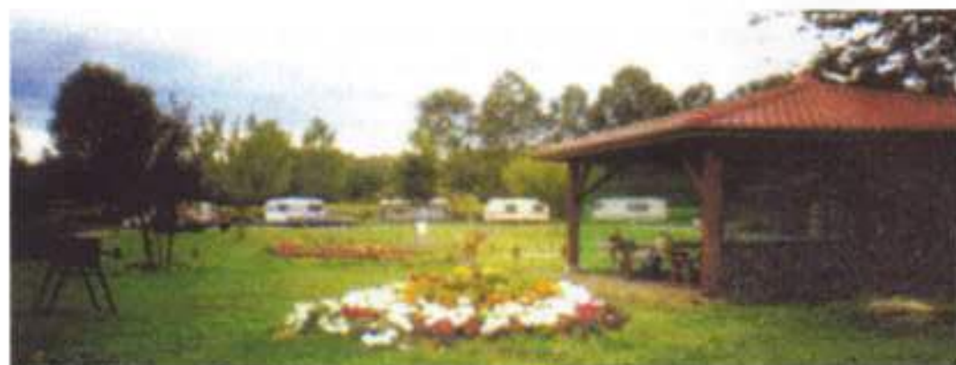
CAMPING DES EYDOCHES - 04 74 54 81 78