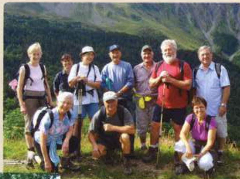
Lors de la randonnée en montagne : La Morte.

Organisation d'un repas annuel des adhérents et conjoints pour accueillir les nouveaux marcheurs et d'un goûter de Noël.