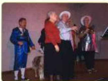
Quelques uns des artistes...

Toutes personnes souhaitant participer sur le devant de la scène ou dans les coulisses, à l'occasion d'une prochaine