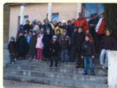
Marcheurs avant le rallye.

L'urne mise à disposition à l'agence postale durant toute la semaine consa-