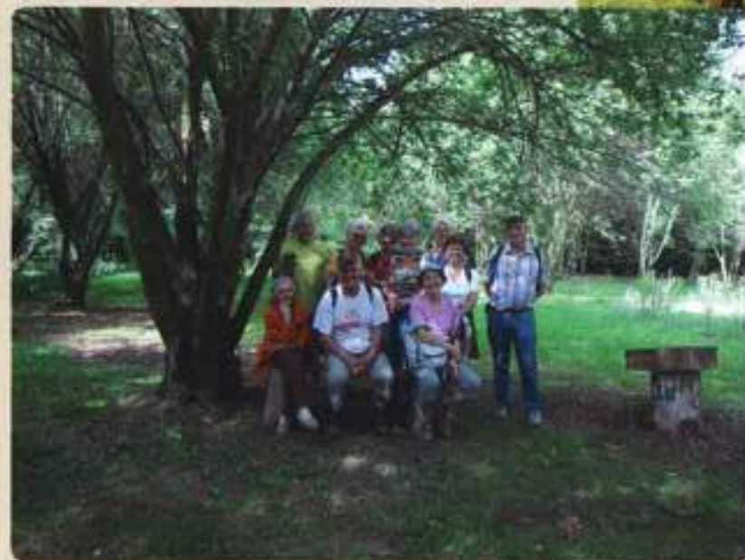
Visite du paradis fouillis à la fin d'une randonnée dans et autour de La Côte St André