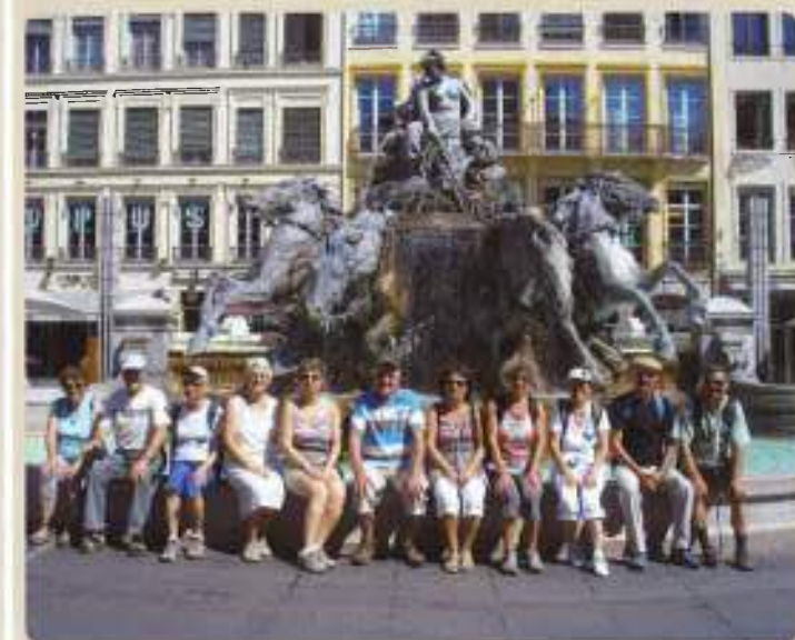
Lors de la visite de Lyon. Place des Terreaux.