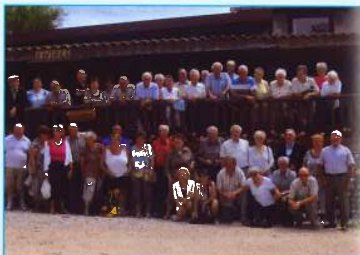
▲ Le groupe à «La Terrine»