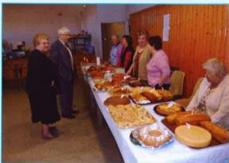
▼ La journée "portes ouvertes"