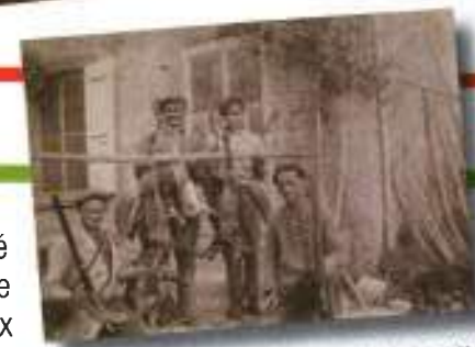
Les reconnaissez-vous ? Déjà à cette époque, le gibier était abondant, ainsi que les prédateurs.