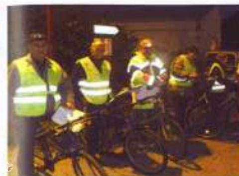
L'accueil des exposants, exercice matinal, il faut de la patience et de la bonne humeur.

Merci et bravo à tous pour cette réussite! Rendez-vous en 2013 et là, nous y sommes, c'est la 25 ème édition, cela se fête, des idées sont déjà en cours et tout le monde est mobilisé!