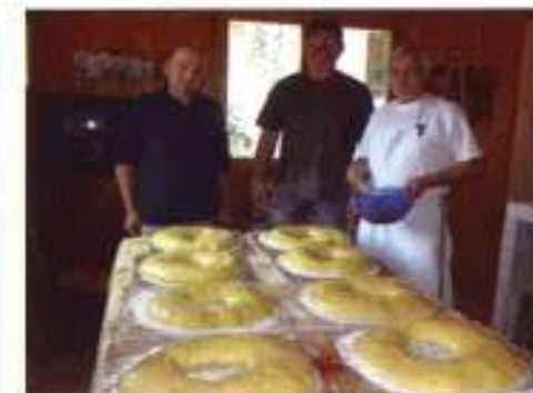
La fabrication des brioches mais d'autres ont aussi la main à la pâte