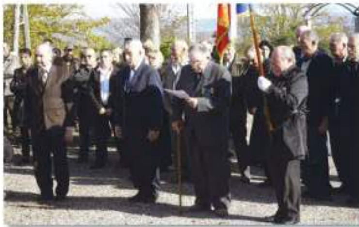
Cérémonie au Monument