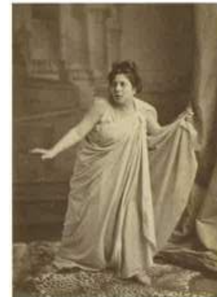
Mme Agar : Camille