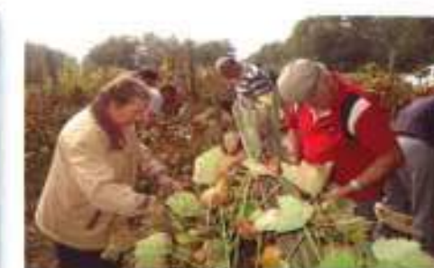
La vendange du raisin pour le vin doux