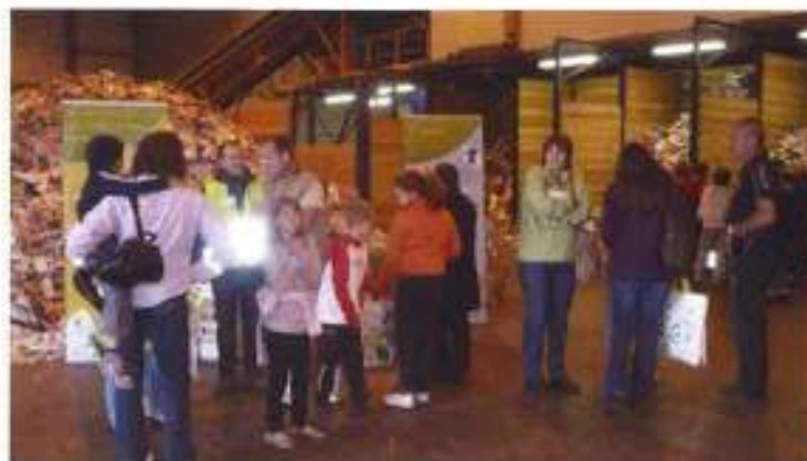
un groupe de visiteurs au centre de tri

De plus la présence de l'association Bièvre Liers Environnement a permis d'obtenir des astuces pour réaliser un bon compost. Pour toutes les questions sur le compostage, vous pouvez contacter BLE au 04.74.54.62.45