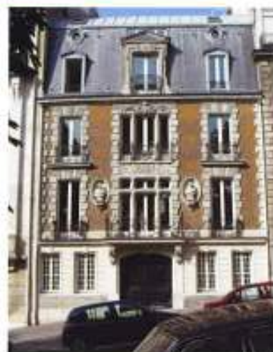
Hôtel particuliers, rue Lenôtre à Paris, construit par Mme Agar

En 1888, alors qu'elle récite Le Cimetière d'Eylau, de Victor Hugo, sur la scène des Gobelins, elle est frappée d'hémiplégie. Après cette attaque elle se retire à Rueil où elle vit dans une certaine misère secourue par Sarah Bernhardt et la famille Rothschild. Elle écrit alors ses Mémoires et un traité sur la tragédie qui paraîtront après sa mort.