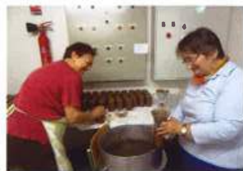
Enorme travail que cette fabrication de la confiture!

Et puis, tous les produits fabriqués par