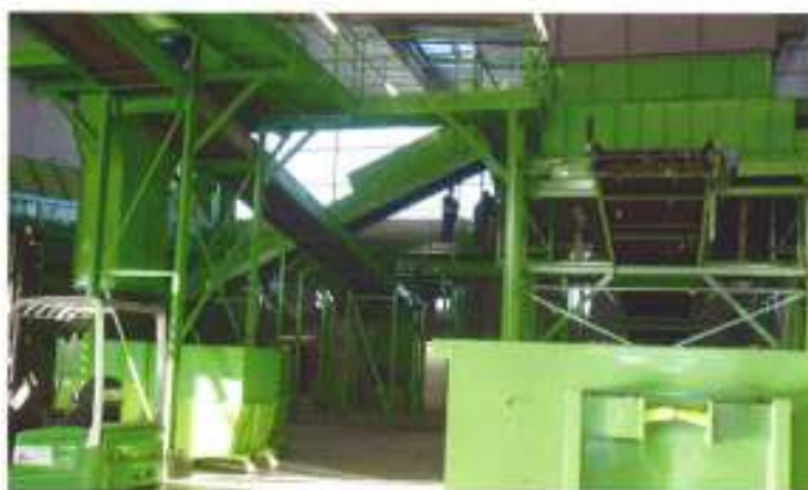
l'unité de traitement mécano biologique en service