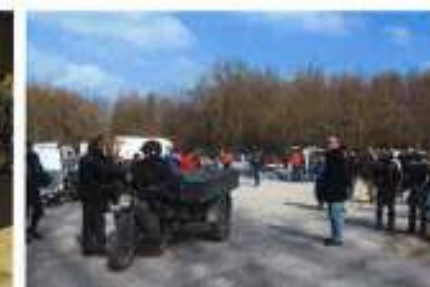
1 : Bourse (mars 2014)