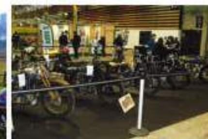
Exposition au Salon de la moto de Lyon (mars 2014)