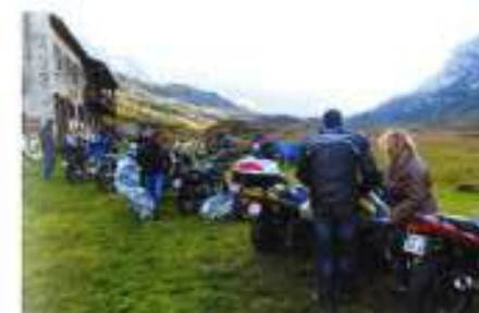
Balade au Mont Cenis (août 2014)