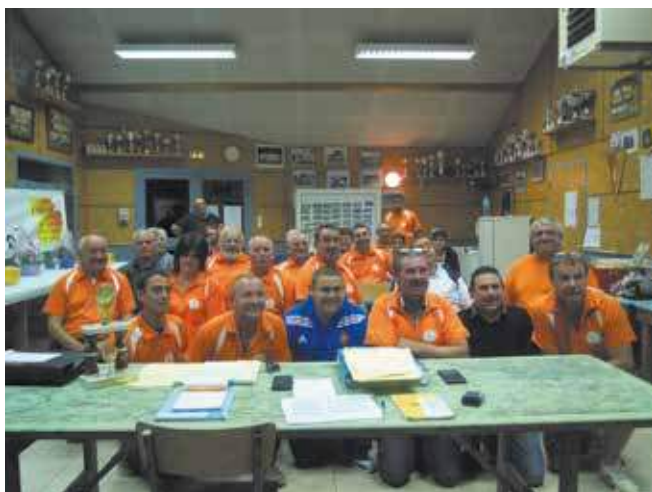
Objet : Compte rendu de l'assemblée générale du 23 Septembre 2016