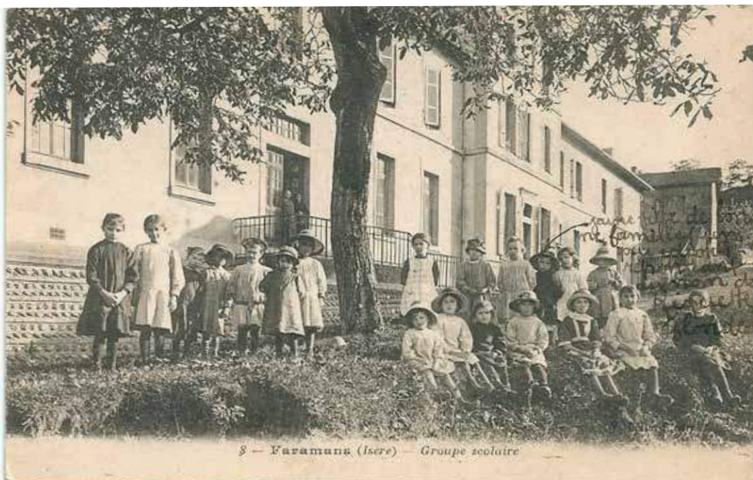
8 — Faramans (Isère) — Groupe scolaire

En 1963, les classes de fin d'études sont supprimées, parallèlement à la création des