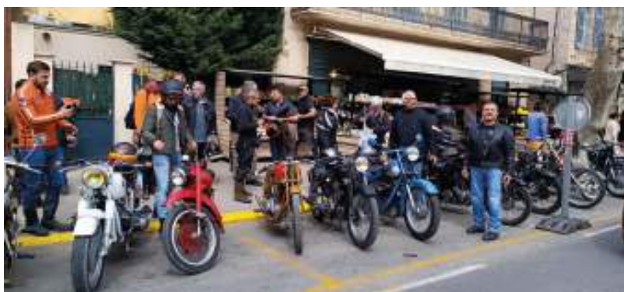
Pose lors du rallye de St Tropez

Si vous souhaitez restaurer des motos, faire des rallyes, rouler sur des circuits historiques ou organiser / participer à des salons motos rejoignez-nous.