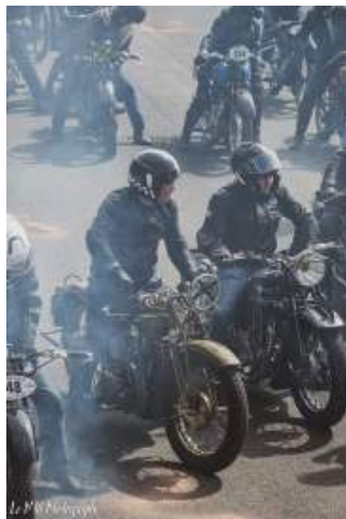
Sur la grille de chauffe à l'autodrome de Montlhéry